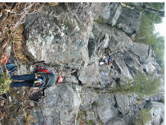
Début de la voie

La vallée est la demeure d'une grande variété de flore et de faune, ils comptent sur ce merveilleux habitat pour leur survie. Votre chemin croisera peut-être celui des perdrix, celui des cerfs, peut-être même d'un orignal ou d'un ours! Les parois hébergent d'autres espèces, tel que le grand polatouche ( Glaucomys sabrinus ), aussi connu comme 'écureuil volant'. Il s'agit d'un omnivore nocturne au yeux désorbités qui est capable de planer des grandes distances entre les arbres... il est même capable de faire demi-tour en plein vol!