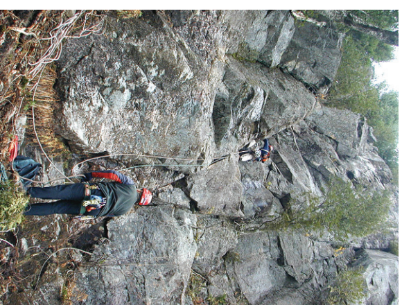
Début de la voie